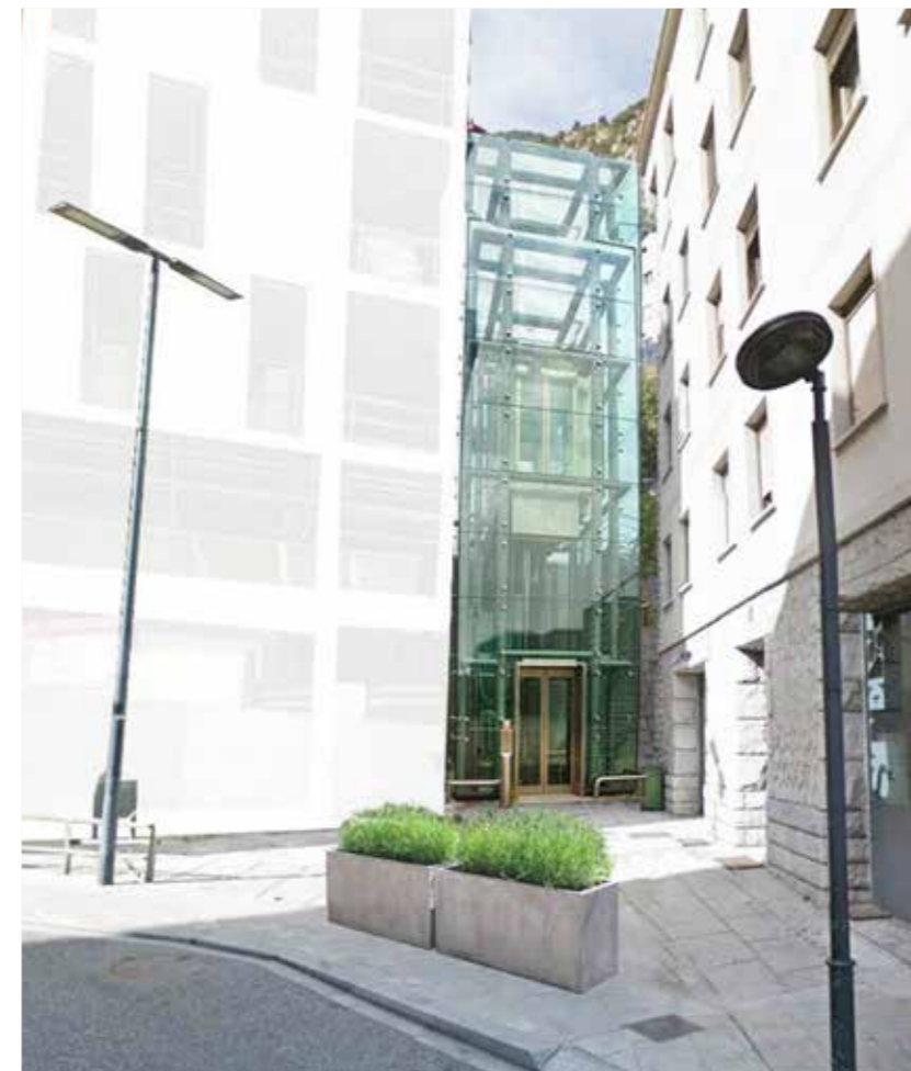
Simulació del futur equipament.

La nova connexió vertical, que es preveu que pugui ser una realitat en els propers mesos, facilitarà la mobilitat dels vianants i millorarà la seguretat en un barri molt densificat i que presenta desnivells accentuats