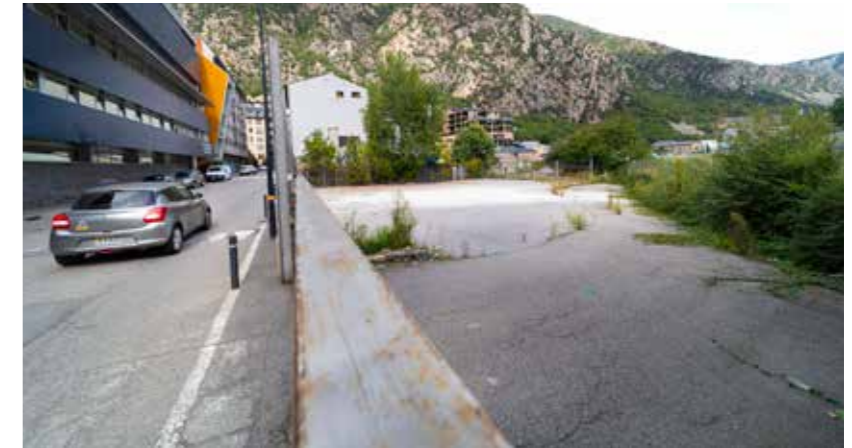
La zona de bàsquet es construirà a tocar de l'Escola Andorrana.

■ El Comú habilitarà properament una zona equipada amb pistes de bàsquet. Aquesta és la proposta que ha rebut més suport popular en la votació de la primera edició dels Pressupostos Participatius, amb un total de 168 vots dels prop de 600 emesos. Les noves instal·lacions s'ubicaran al carrer Prat Salit, en un terreny a tocar de l'Escola andorrana. La consellera de Desenvolupament estratègic i comercial i de Projectes Participatius, Meritxell López, feia a principi de juliol un bon balanç d'aquesta primera experiència ciutadana que, deia, "ha posat de manifest que comptem amb una ciutadania plenament compromesa i amb ganes d'implicar-se activament en la presa de decisions col·lectives". A més, va avançar que s'estudiaran noves vies i canals de participació directa "per seguir donant veu als ciutadans de la parròquia".