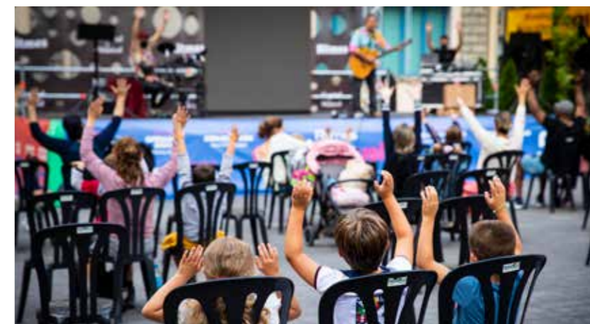
El 'Ritmes menuts', amb concerts per als infants cada dilluns d'agost, ha estat una de les novetats de l'estiu.

natura, història i patrimoni. Entre les novetats, s'han organitzat sortides per viure l'experiència de ser apicultor per un dia i conèixer el procés de producció i recol·lecció de la mel, excursions al Bosc negre amb una sessió de ioga inclosa, i caminades per conèixer els secrets del romànic d'Andorra la Vella, amb la visita a la capella de Sant Andreu i l'església de Sant Esteve. A més, s'han mantingut les activitats d'altres anys que tenen molt bona acollida, com les visites teatralitzades pel Centre històric d'Andorra la Vella i el poble de Santa Coloma, visites guiades per conèixer punts d'interès com Casa de la vall o el barri antic, itineraris pel rec del Solà, i sortides a la vall d'Enclar i la vall de Santa Coloma, la Vall