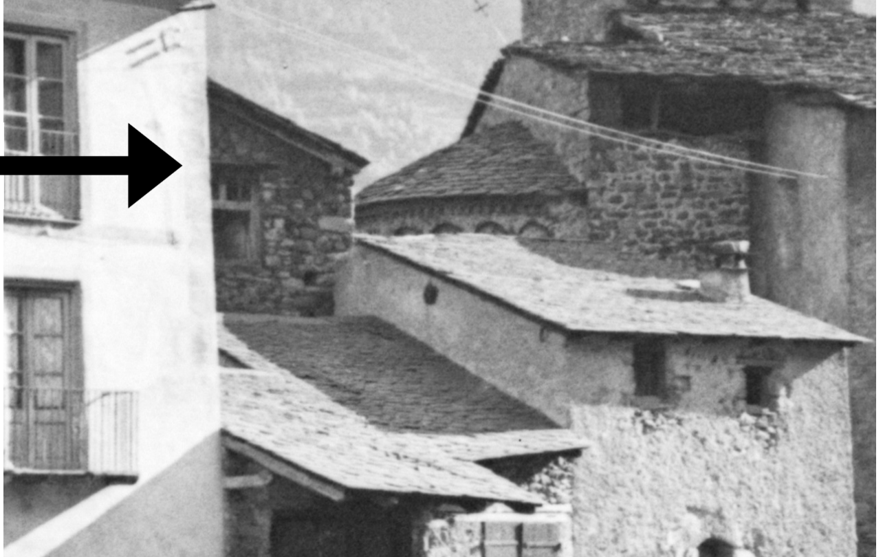
Amb la fletxa s'indica l'edifici que podria ser l'antic hostal comunal d'Andorra la Vella

La ubicació de l'hostal d'Andorra la Vella es trobaria prop de l'absis de l'església segons descriu Ludmilla Lacueva. Tot i així no hem pogut ubicar-lo malgrat que podem discernir la rectoria, la casa del quart, la carnisseria i la presó. Per tant, podia ser un edifici que sobresurt darrere d'aquests edificis i que tindria l'entrada per l'absis de Sant Esteve.