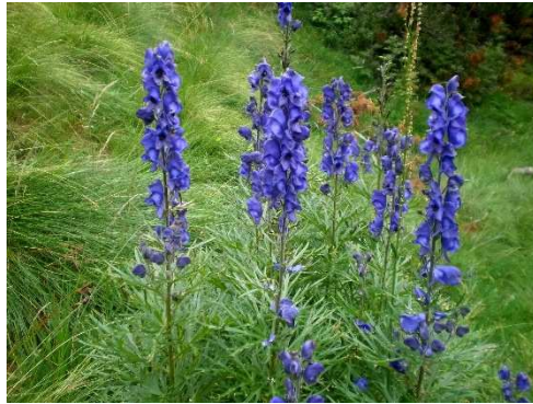
Planta de tora.