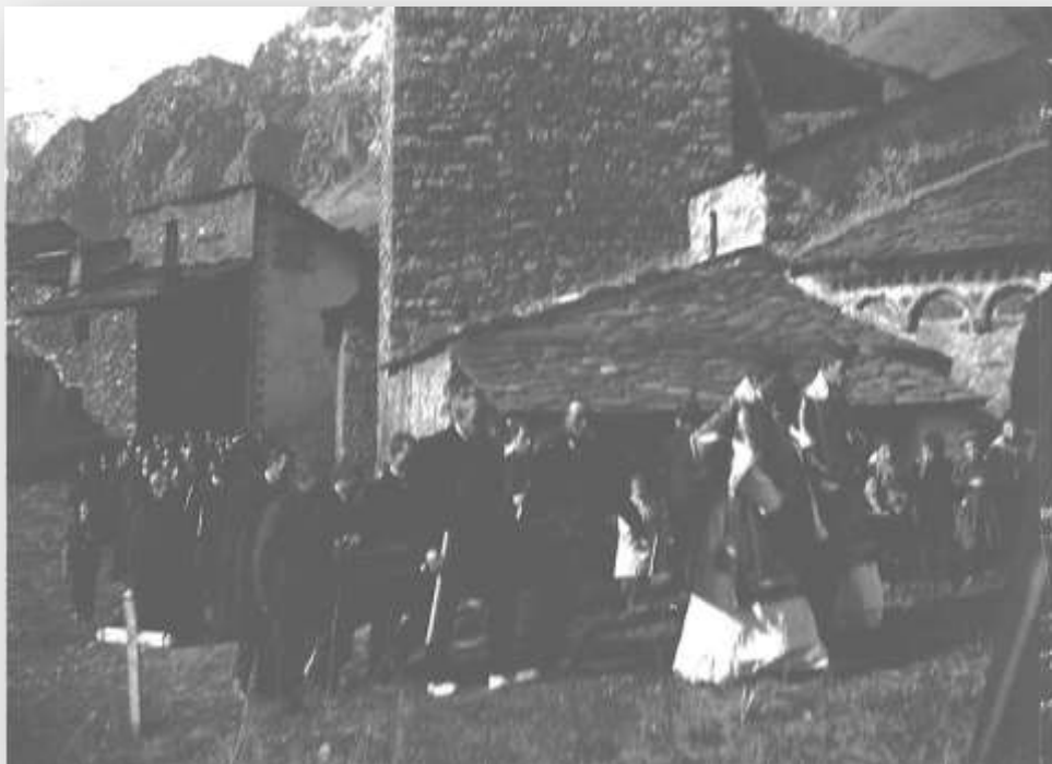
Instantània de la comitiva d'un enterrament al cementiri vell, ubicat darrere de l'església parroquial de Sant Esteve d'Andorra la Vella. CRA_0198_ANA

En època medieval les primeres formes de govern comunitari a Andorra van ser les assemblees de veïns que es trobaven als porxos de les esglésies o cementiris. La creació del Consell de la Terra (1419) va ser l'avantsala de l'estructura comunal amb la legitimitat perquè els prohoms -persones més influents- de les viles andorranes poguessin nomenar representants per actuar d'interlocutors amb els coprínceps.