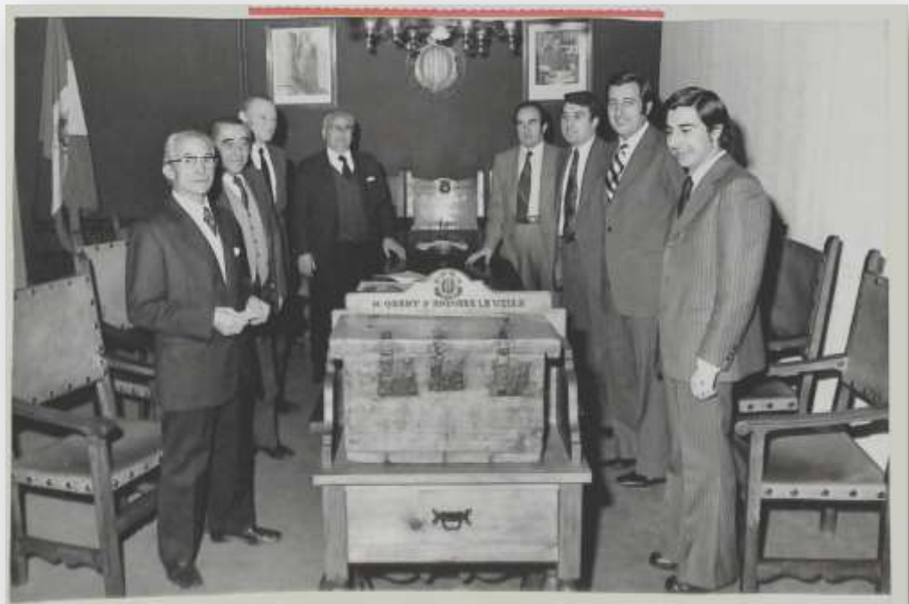
Sala del Consell del Quart d'Andorra la Vella. Eleccions de l'any 1975

27 DESEMBRE 1707. Consell: "per a fer elecció de cònsols lo any 1708 i se ha elegit per al quart d Andorra a Miquel Guitart Aldias i per al quart de las Caldes i Angordany per cònsol en cap a Guillem Molas Ricart Libre d'actes del Comú d'Andorra