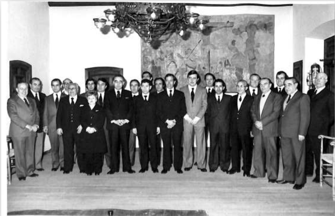
Preses jurament del Comú d'Andorra amb els integrants dels dos quarts_28-12-1975. Casa de la Vall.

La Revolució de 1933 va derivar en l'atorgament del sufragi universal masculí per als majors de 25 anys i en el decurs del temps, de forma gradual, els quarts assoliren més autonomia al transferir-se certes competències comunals fins a esdevenir a la pràctica gairebé administracions autònomes. El vot femení es va sancionar l'any 1970 i l'elegibilitat de les dones l'any 1973.