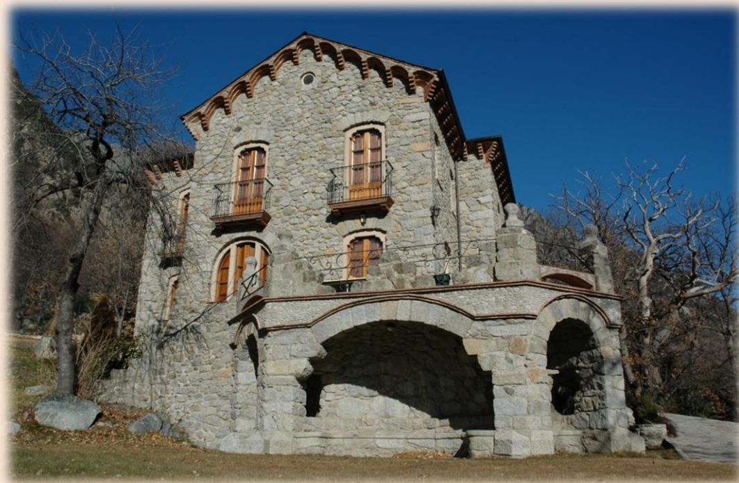
Torre dels Russos.