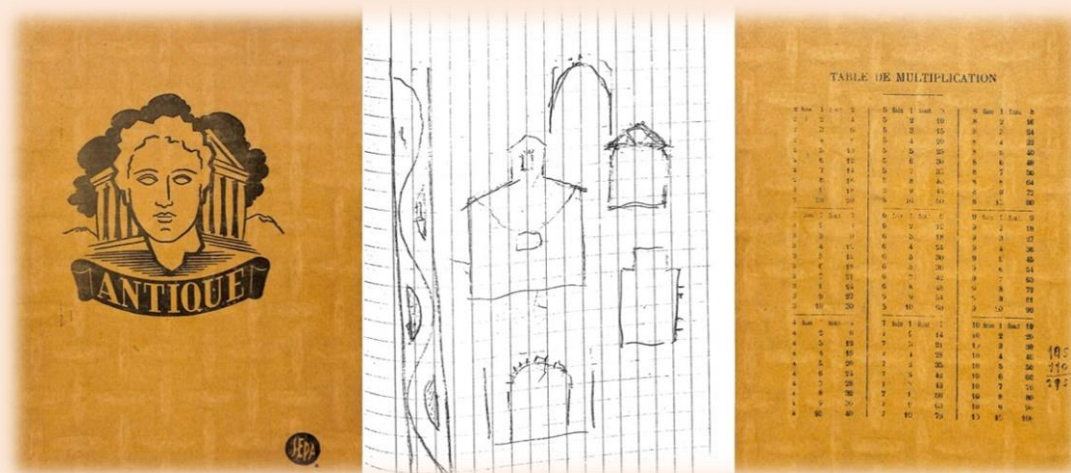
Imatge de la portada i contraportada del llibret d'apunts i croquis.